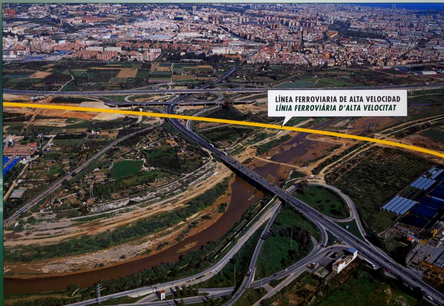
LÍNEA FERROVIÀRIA DE ALTA VELOCIDAD LÍNIA FERROVIÀRIA D'ALTA VELOCITAT